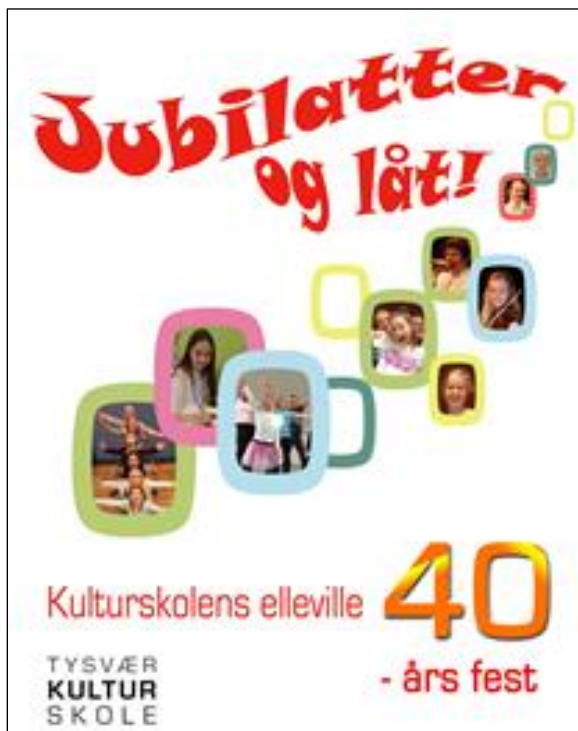
Plakat frå kulturskolen si jubileums framsyning i november 2015

Kulturskoleplanen er for perioden 2017-2027.