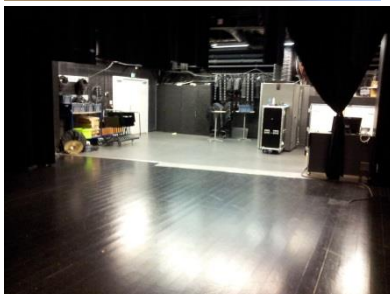
Ex. på gode rom for kulturskole.