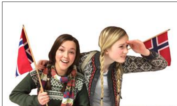
Frå "200 år med grunnlov" mai 2014, samproduksjon kulturskule og skule