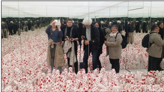
Personalet på Hennie Onstad kunstsenter, Foto: Kine Lorås.

Framover kan det vere bruk for å harmonisere arbeidsavtalar og arbeidskvardagen enda meir. Det ligg og eit potensiale i å utnytte under- og overkapasitet i dei ulike kulturskulane, dersom ein får til smidige løysingar for kjøp og sal av pedagogiske tenester.