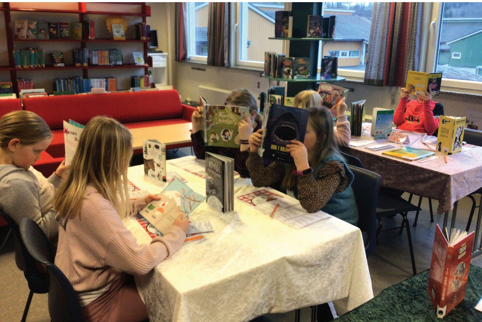
Klart for bokcafé og bokmeny på Grinde