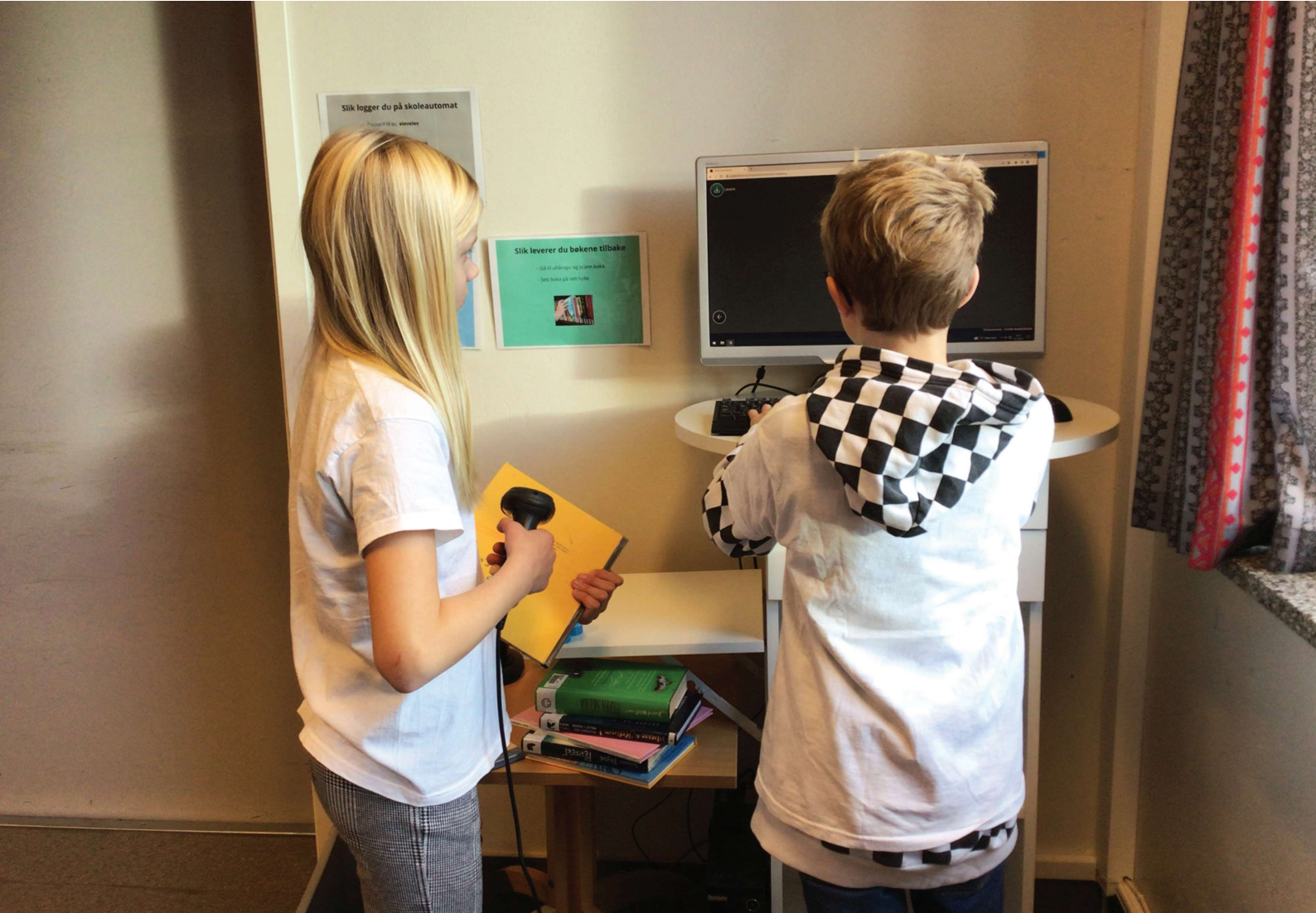
Elevene betjener utlånet selv