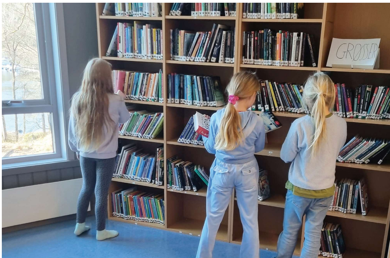
Skolebiblioteket på Førland skule

Rektor setter av et årlig budsjett for skolebiblioteket.