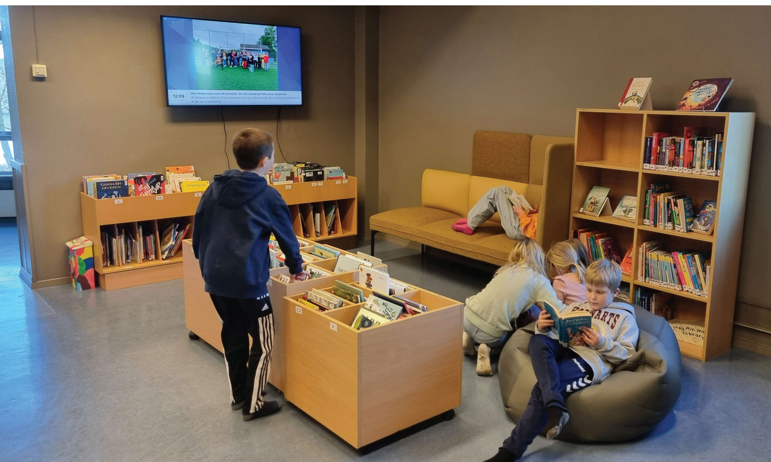
Det leses og diskuteres på Førland skule

Satsing på skolebibliotekene er et viktig virkemiddel i et langsiktig arbeid for å skape gode lesere.