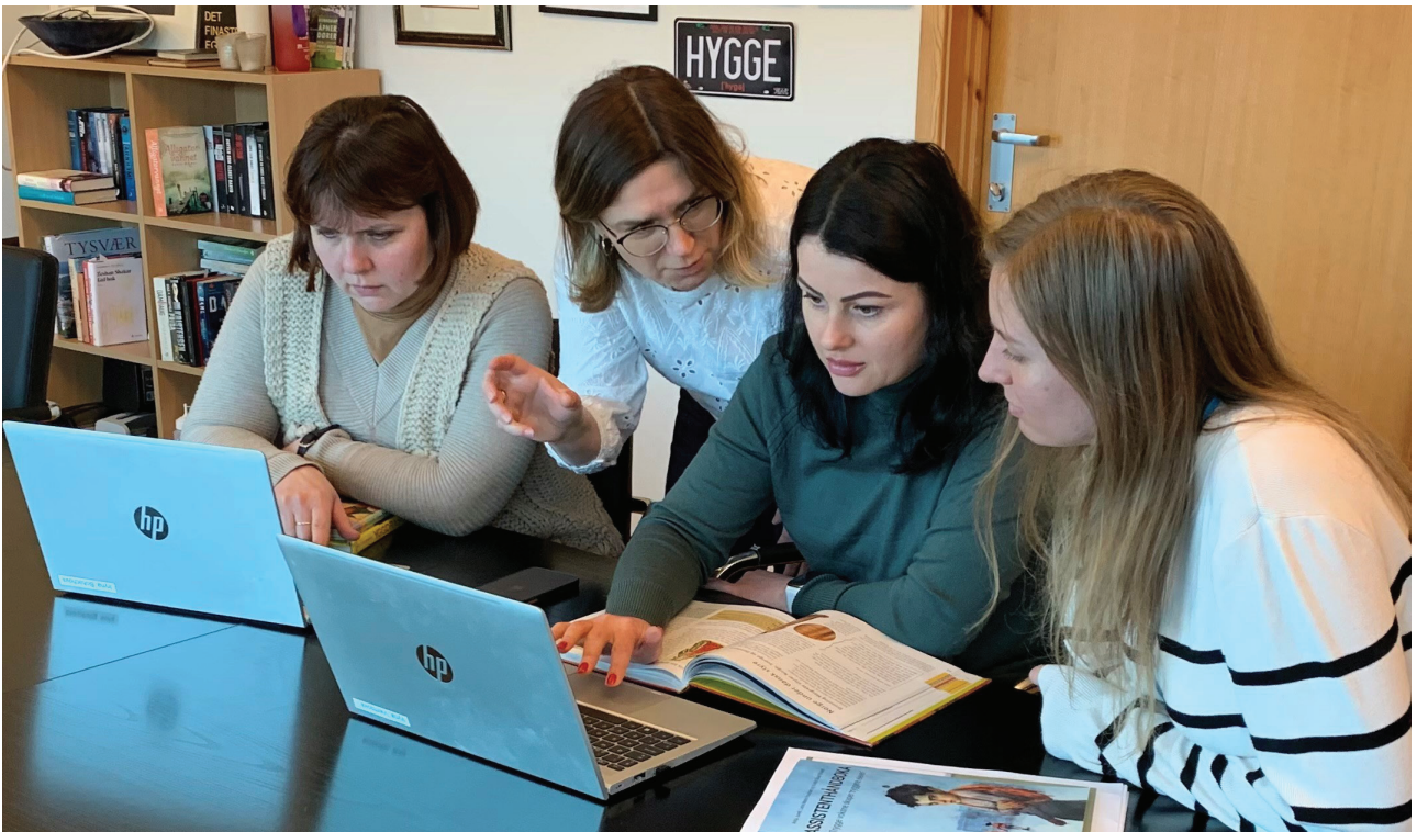
Veiledning i gruppe