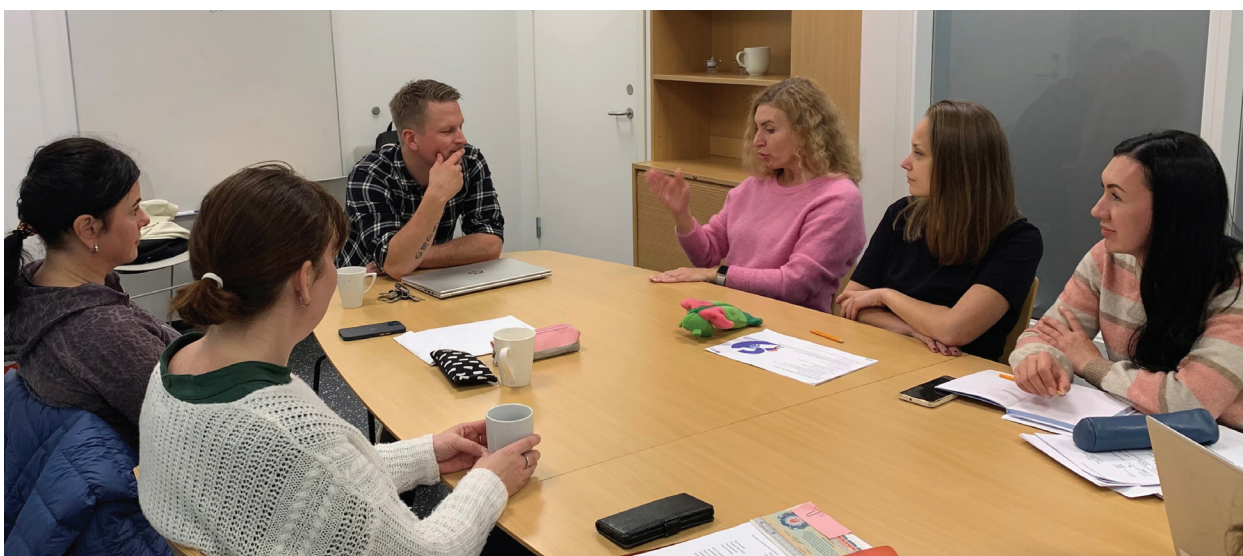
Oppfølgingsmøte med veileder fra NAV