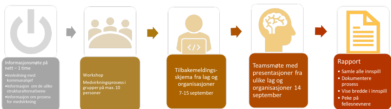
Figur 1 - prosesslinje for medvirkning

Figuren under viser prosesslinje for medvirkning