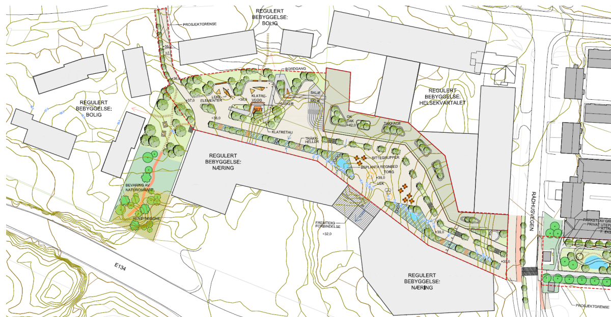
Illustrasjon Aksdal Vest

Aksdal Vest er en av tre deler i parkdraget. Aksdal vest er regulert til sentrumsutvikling med forretning/kontor/tjenesteyting (Felt BKB1) i sør, Bolig/tjenesteyting (Felt BKB2) i nord og boligbebyggelse (Felt BKS1 og BKS2) i nord og vest. Parkdraget inngår i reguleringsplanen, regulert til hhv. lekeplass (Felt o_BLK), gangvei/gangareal/gågate (Felt SGG1 og SGG2) og torg (Felt ST). I dette prosjektet er det tatt med en utvidelse av parkdraget, slik at det også omfatter byggegrenser til omkringliggende bygg samt et mulig taklandskap på bygg i nord (Helsekvartalet). Dette gir en mer helhetlig løsning av hele området, og gir parkdraget et større areal.