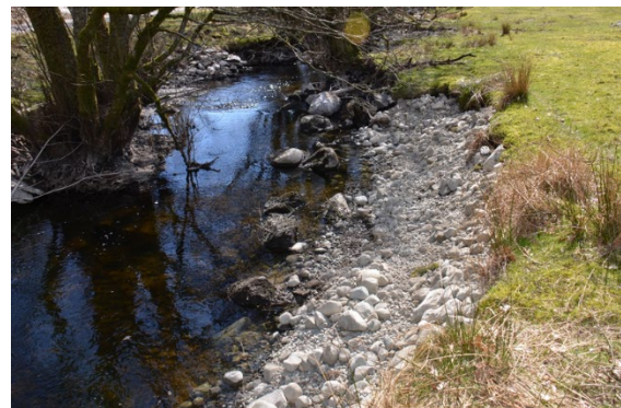
Naturlig erosjonssikring ved bruk av større og mindre stein.

Har du en bekk eller elv som fører laks og sjørørret, og hvor økte nedbørmengder allerede skaper eller kan skape utfordringer for jordbruksdrifta di? Ta kontakt med Anders eller Sven-Kato for en prat: