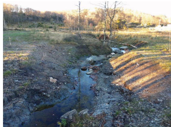
Nylig utgravd bekkeløp med tilført stein og grus, og plantet kantvegetasjon.

gjennomført en rekke tiltak i samarbeid med bønder. Eksempler på tiltak er utlegg av gytegrus og stein, planting av kantvegetasjon, naturlig erosjonssikring med stein, utbedring av vandringshindre, gjenslynging av bekkeløp og bekkeåpninger. En opplever nå i større grad enn tidligere at vassdrag som er lagt i rør og kanalisert ikke håndterer den økte nedbøren. SMIL og andre støtteordninger kommunen har tilgang på, kan derfor være med å fullfinansiere restaurering som øker ungfiskproduksjonen og samtidig gjør vassdragene mer robuste overfor fremtidens klima. Under vises bilder fra et delvis ferdigstilt restaureringsprosjekt i Tysvær.