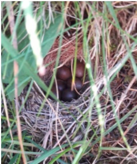
Et fuglereir på bakkenivå. Reiret ble avslørt av fugle-mor som spilte skada i forsøk på å lede oss bort fra reiret.