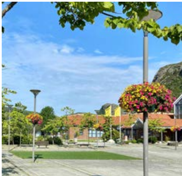
Lars Hertevig plass, Tysværtunet