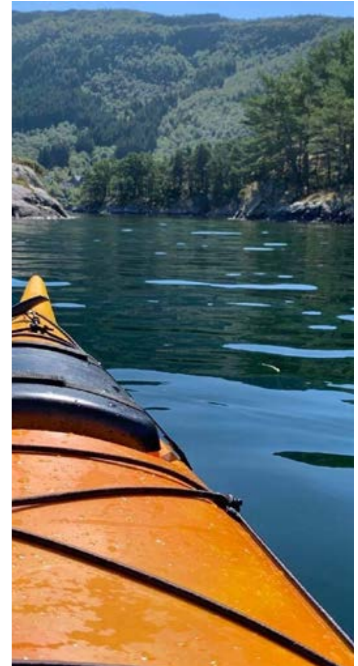
Kajakk i Nedstrandfjorden