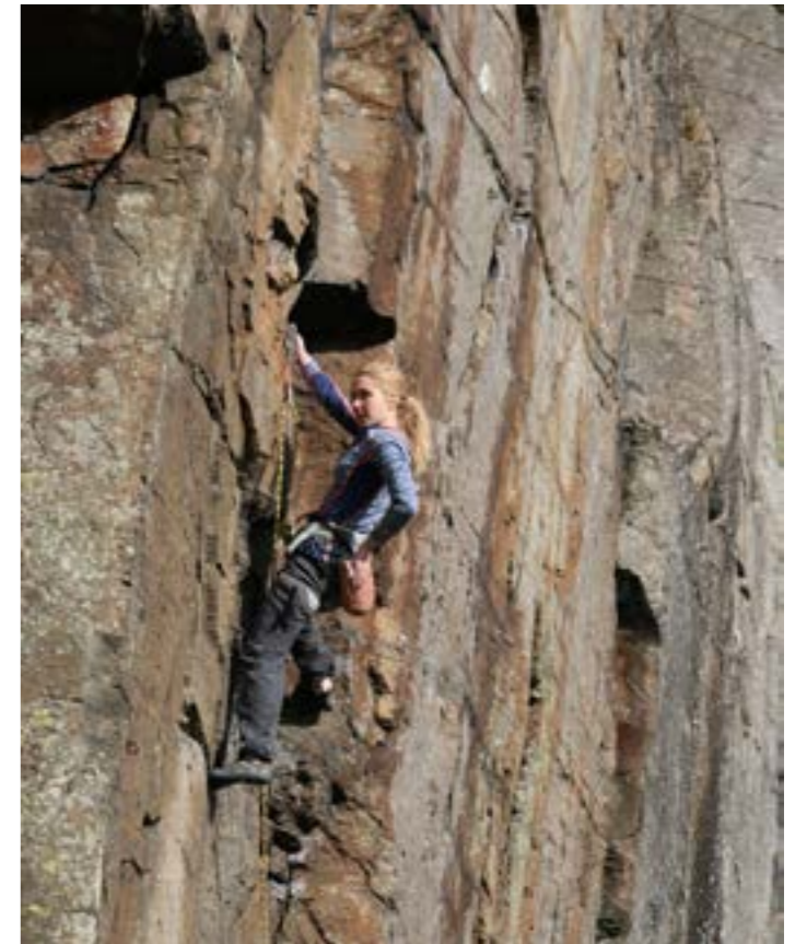
Klatrefjellet Kårstø

There are also many other climbing mountains in Tysvær - Valhest, Hodnafjell and Nedstrand. (Kreppene, Yrkje and Espevik) Check out the website http://h-k-l.org/ for more information.