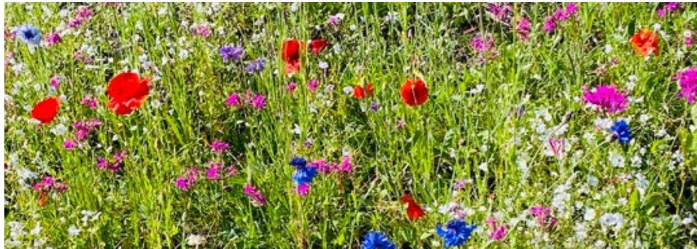
Blomstereng ved Bongsatjørn - Aksdal

Er du glad i luftige toppturar, rusle på koselege turstiar eller besøke ei bortgøymd strand?