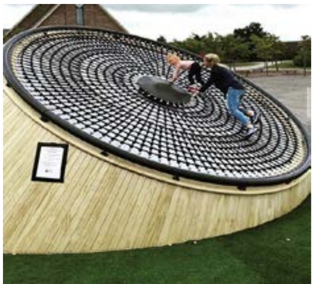
Lars Hertevig plass, Tysværtunet