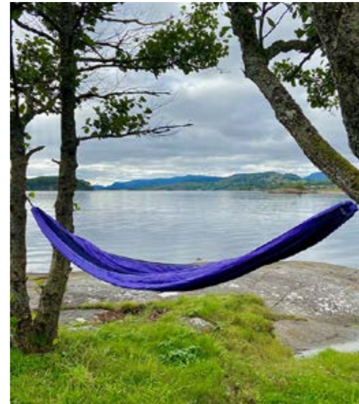
Leirå i Nedstrand

Are you ready for an airy mountainhike, a quiet walk in amazing nature or visit a hidden beach? Then you are in the right place. We have a lot of places in open air, were you can walk, cycle, paddle canoe or just enjoy the silence of the nature in a hammock. There is also a lot of fishing facilities in different lakes and deep sea.