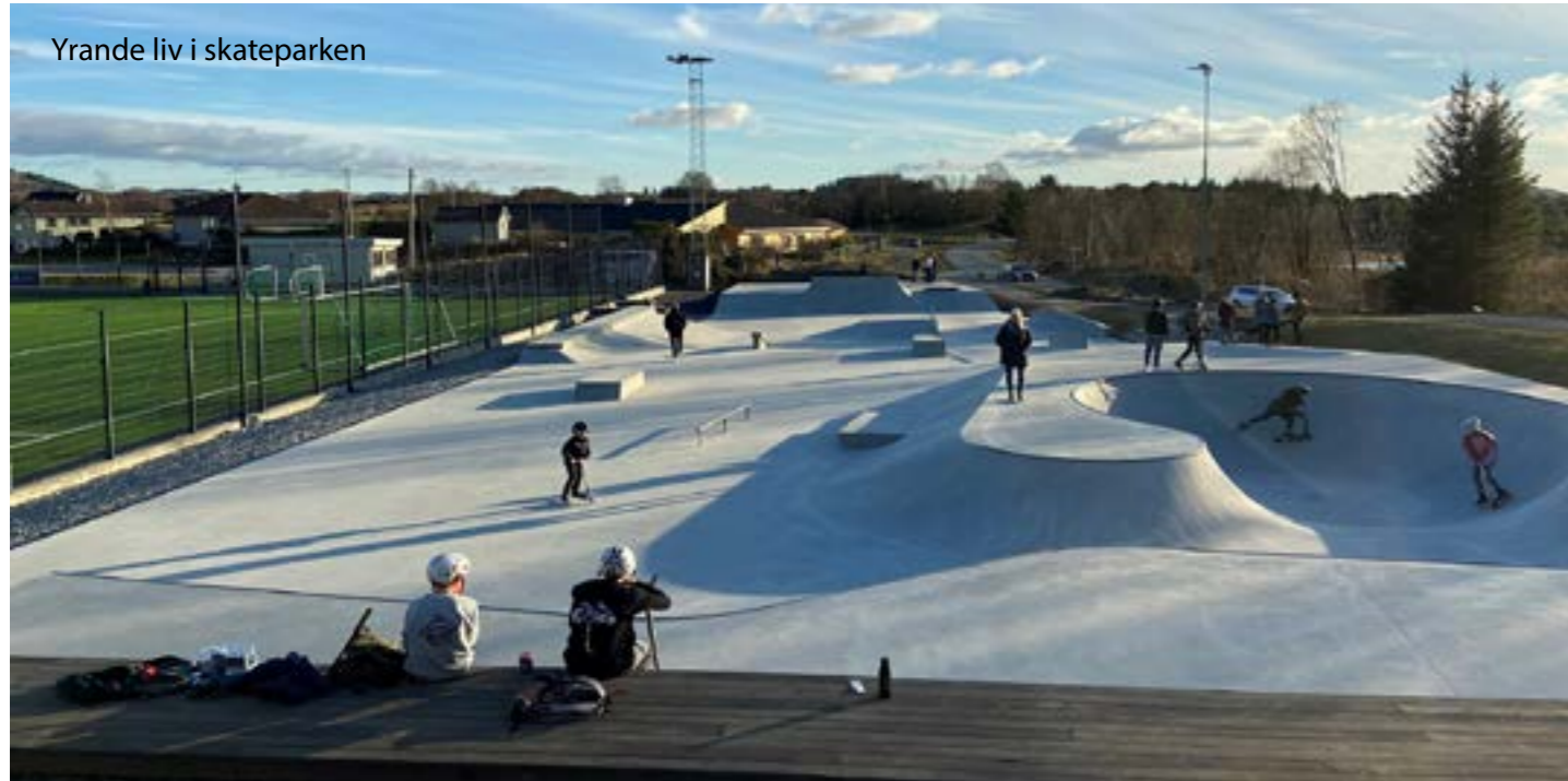
Yrande liv i skateparken

At Frakkagjerd you will find a top modern skating park for children and young people.