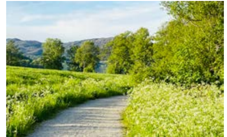
Løypa rundt Akسدalsvatnet

Start the bike ride in Akسدal, and continue on the low-traffic "old road" to Førland - Tysværåvåg - Slåttevik - Hervik - Skjoldastraumen and Nedstrand. Along the route there are several campsites were you can rent a cabin and stay over in your own tent. After some nice days in Nedstrand you can take the ferry from there and further inland Ryfylke.