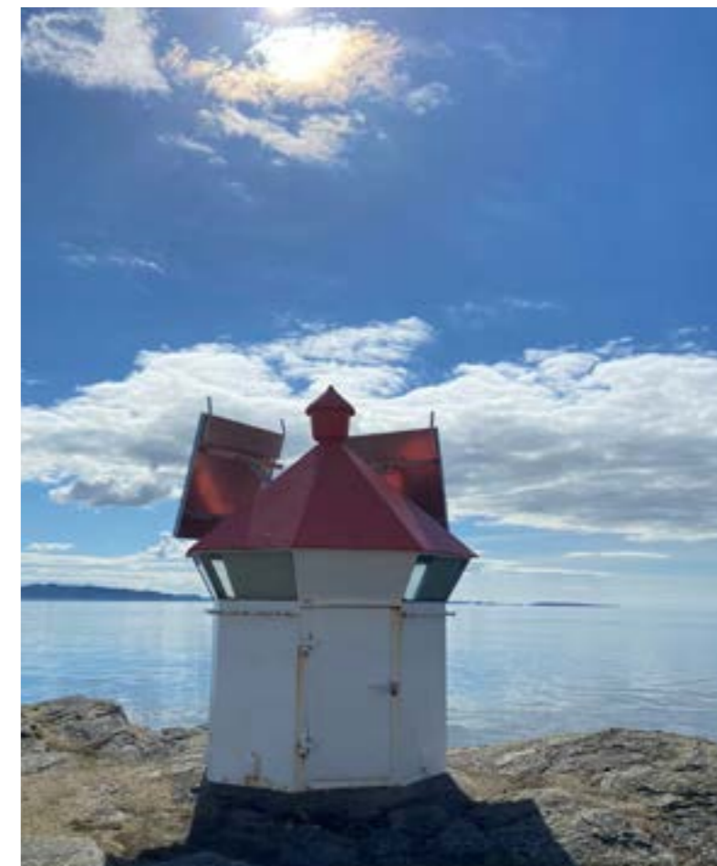
Tunganes fyr - Nedstrand

Tveit VGS, Hinderåvåg, Nedstrand Telefon: 994 44 710