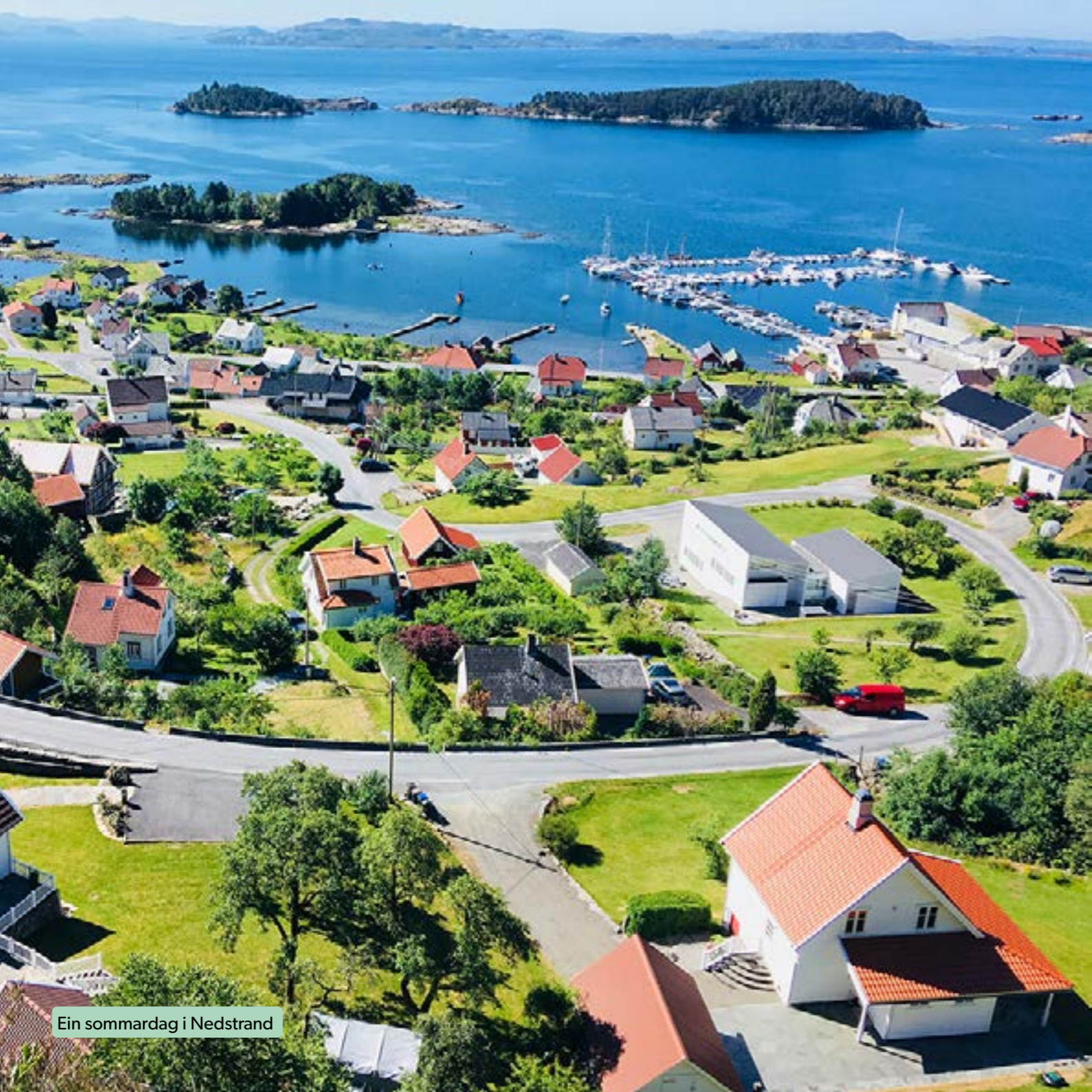
Ein sommardag i Nedstrand