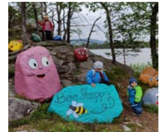
Smilevegen - Hervik